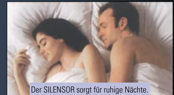
Der SILENSOR sorgt für ruhige Nächte. Reden Sie mit Ihrem Zahnarzt.