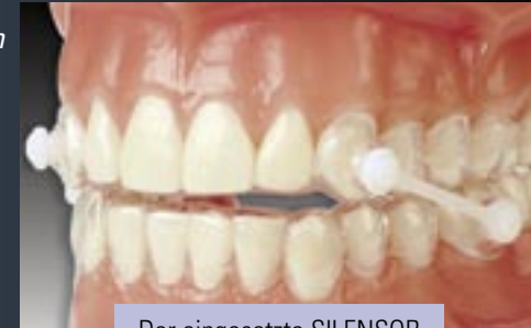
Der eingesetzte SILENSOR

Beim Einsetzen des SILENSORS wird in der Regel eine leichte Spannung empfunden. Diese verschwindet rasch. Auch das morgendliche Gefühl, dass die Zahnreihen nicht mehr richtig zusammenpassen, hält nur kurz an. Letzteres entsteht durch veränderte Muskelorientierung und/oder lymphatische Flüssigkeit im Gelenkspalt.